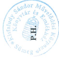
Oszkai Réka Viola igazgató